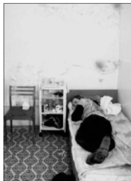
платную медпомощь! Бумага все стерпит.