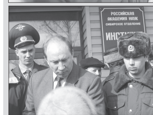
Посланцу Зюганова «разрешили» поговорить с народом.