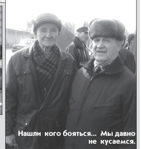
Нашли кого бояться... Мы давно не кусаемся.