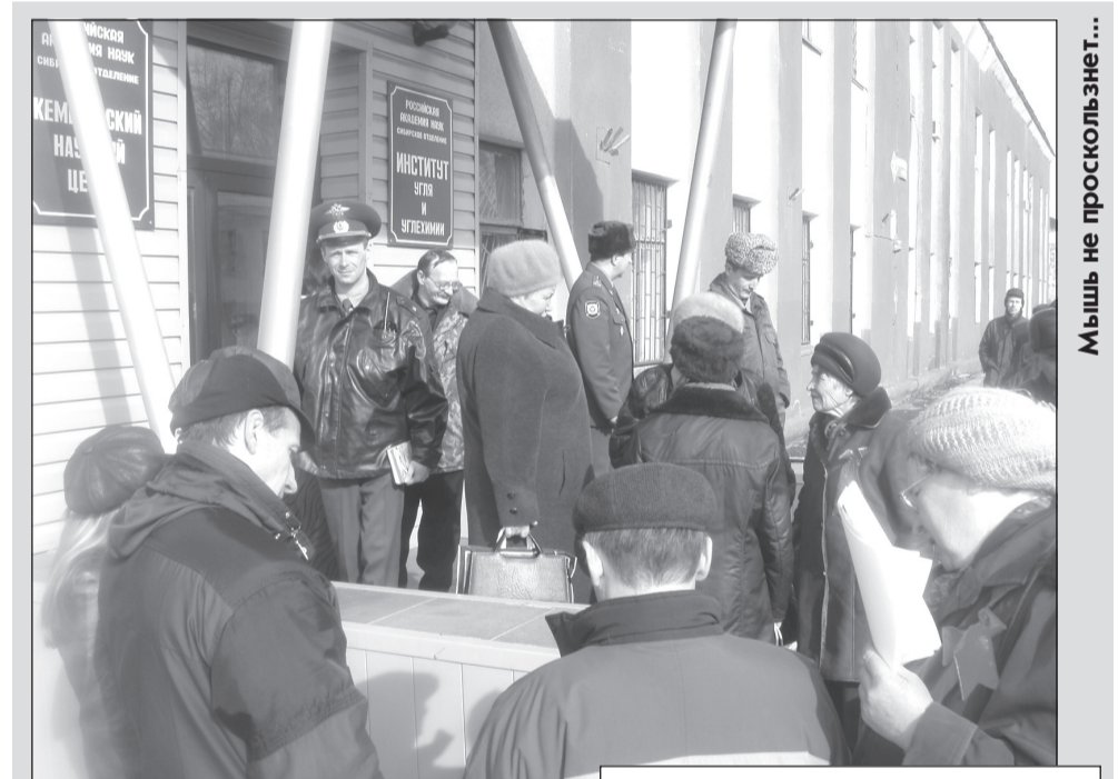
Мышь не проскользнет...