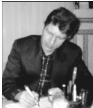
- На ваш взгляд, беловчане интересуются политикой?

— Народ очень пассивный. Свои проблемы, свои заботы. Если по телевизору только «Единая Россия» и Путин, то люди, как зомби, идут и голодают за них. Организовали акцию для молодежи, и она купилась на мобильники и майки «единороссов». Есть, конечно, люди, которые всё видят, понимают и не хотят голосовать за эту партию, а его заставляют. Такие голосуют против всех.