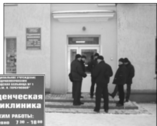
Студенческая поликлиника РЕЖИМ РАБОТЫ: ежедневно 7:30 - 18:00 суббота 8:00 - 14:00 воскресенье выходной КЕМЕРОВО, ШАХМАТСКАЯ 110

В студенческой среде общеизвестно, что в Межвузовскую можно ходить только за справками. Получить справку в Межвузовской невыносимо трудно. Мы с одной из студенток совершили экскурсию по поликлинике и встретили вал откровенного хамства, начиная от гардероба и заканчивая кабинетами врачей. Меня, вероятно, также принимали за студента по причине далеко не почтенного возраста. Возможно, нам не повезло, возможно, магнитные бури испортили некоторым эскулапам настроение, но нас не единожды прилюдно незаслуженно обругали. Необходимую справку студентке не дали, заметив при этом, что «вы и ходите сюда только за