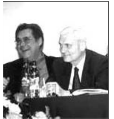
ТУЛЕЕВ НЕ ЗАХОТЕЛ СТАТЬ ДРАЧЕВСКИМ стр. 3

Общественно-политический еженедельник из Кузбасса