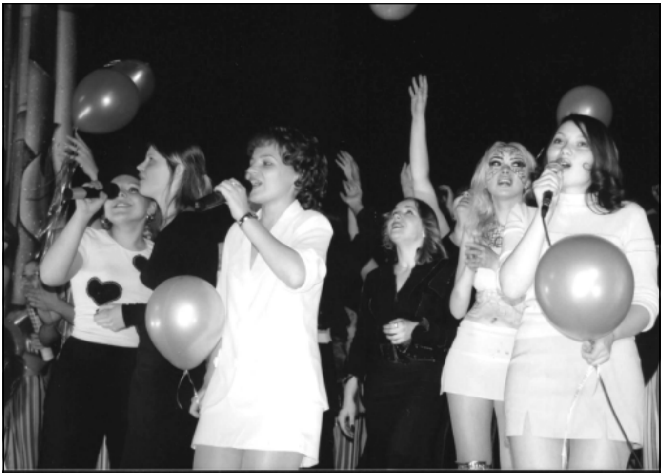
1.04.2003 г. Кемерово. Концерт химико-технологического факультета технического университета в рамках регионального фестиваля «Студенческая весна».