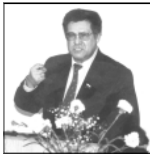
Губернатору Кемеровской области Тулееву А.Г. Уважаемый Аман Гумирович!

Мы знаем Вас как справедливого человека, который борется за повышение жизненного уровня жителей г. Кемерово и Кемеровской области.