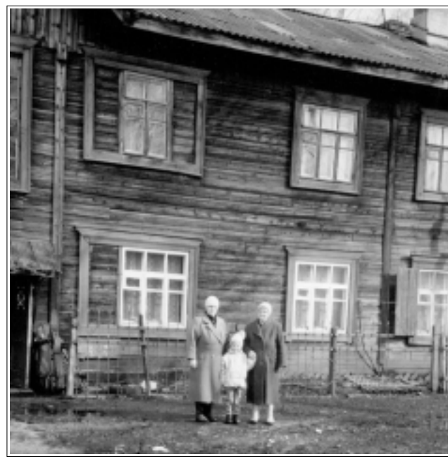
Здесь живут люди. А должен быть музей нищеты и бесправия «простых» людей.